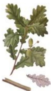
Dub letný Quercus robur L.

Uvaríme dubovú kôru z dubu letného / Quercus robur L./ alebo z dubu zimného / Quercus pertacea (Mattuschka) Liebl /.