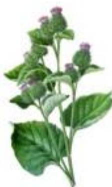
Lopúch väčší Arctium lappa A. majus