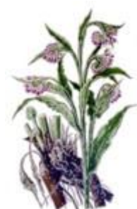
Kostihoj Lekársky Symphytum officinale L

Lopúch umyjeme pod studenou vodou ako tanier 4 – 5 krát.