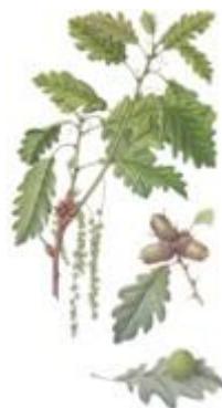
Dub zimný Quercus pertacea

Polovicu nádoby zaplníme dubovou kôrou a zalejeme vodou.