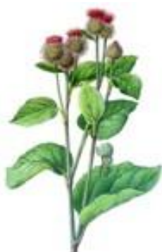
Lopúch plstnatý Arctium tomentosum

Pomocou listu lopúchu možno predčasne diagnostikovať choroby a hlavne jeho použitím možno tieto choroby následne v krátkom čase vyliečiť bez akýchkoľvek vedľajších účinkov a bez akýchkoľvek farmakologických liečiv, prípadne bez nutnosti podrobenia sa operáciám.